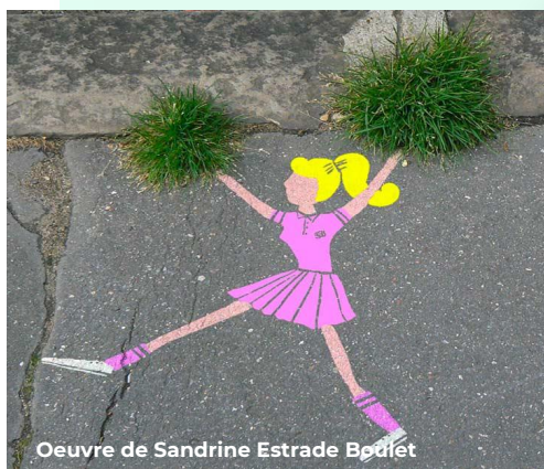
Oeuvre de Sandrine Estrade Bodet

Un projet collaboratif passerelle entre 5 classes de primaires et 5 classes de collèges de la Métropole de Lyon. · Pré-inscription en ligne depuis la tuile Classes Culturelles Numériques du site www.laclassse.com